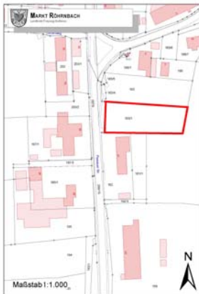
Gem. R, Flur 163.png

Kommune: Röhrnbach Gemarkung: Röhrnbach Flurstück-Nr: 163/1 Straße: Passauer Str. 39 Baugebiet: Lage: Mischgebiet Fläche: 1998 m 2 Preis: VB Bemerkung: